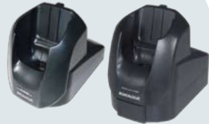
Puits/chargeurs (USB, RS232/USB, RS232, Ethernet)