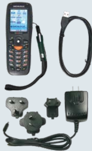
Contenu du package