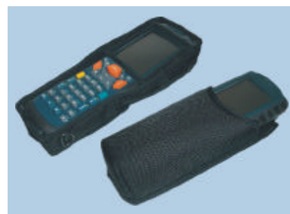
Housse fonctionnelle et etui de protection