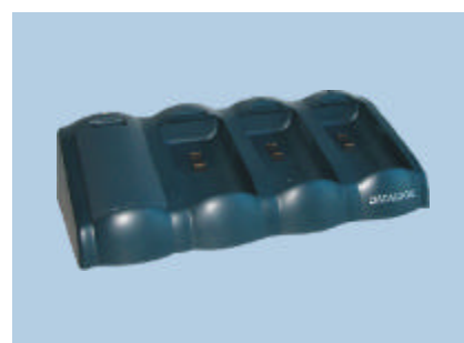
Chargeur de batteries multiples