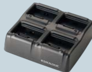
Puits/chargeur simple et Chargeur multiple de batteries