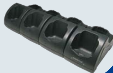
Puits/chargeur Ethernet 4 positions