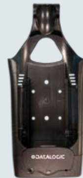
Chargeur pour véhicule